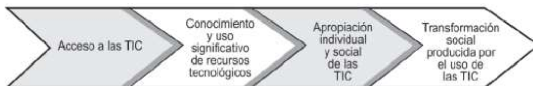
Figura 2. Taxonomía para la valoración del impacto

Por su parte, Atuesta (2005) propone un esquema que identifica cuatro categorías para la evaluación del impacto de las TIC en la sociedad y en la cultura (figura 1).